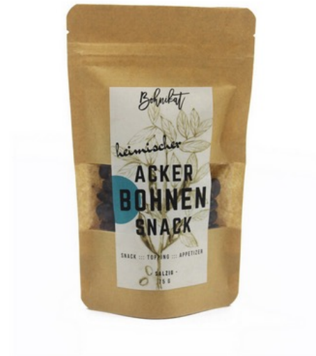
75 g geröstete Ackerbohnen – salzig –