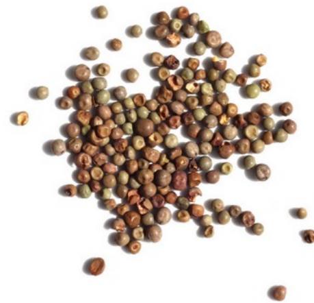
Vorankündigung: Dunkle Erbsen, roh