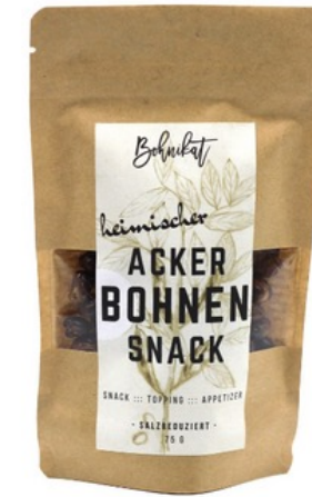
75 g geröstete Ackerbohnen – salzreduziert