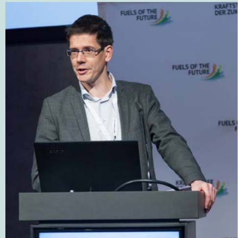
Bas Eickhout, Europäisches Parlament - Berichterstatter des Umweltausschusses zur REDII

Mitglied des Europäischen Parlaments, MdEP, Berichterstatter Umweltausschuss REDII, erläuterte den Beschluss bzw. die Standpunkte des Europäischen Parlamentes vom 16.01.2018. Die seit 2008 bekannten und durch verschiedene Studien grundsätzlich bestätigten Effekte indirekter Landnutzungsänderungen (iLUC), bedingt durch den Biomasseanbau zur Biokraftstoffproduktion, rechtfertigten den Ausstieg aus der Erzeugung von Biokraftstoffen aus Nahrungsmittelpflanzen. Mit einer Deckelung der klassischen Biokraftstoffe schaffe das Parlament nach langen Diskussionen einen Kompromiss und damit Klarheit für die zukünftige Entwicklungsperspektive für Biokraftstoffe aus Biomasse. Flüssige Biokraftstoffe sollten auf die Sektoren Schiffs- und Flugverkehr beschränkt werden.