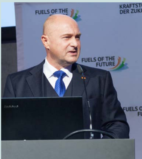
Rainer Bomba, Staatssekretär im Bundesministerium für Verkehr und digitale Infrastruktur (BMVI)

RAINER BOMBA, Staatssekretär im Bundesministerium für Verkehr und digitale Infrastruktur (BMVI) betonte, dass Deutschland fähig ist, die Herausforderungen zu bewältigen. Die Mobilität von Personen und Gütern muss bei gleichzeitigem Schutz des Klimas gesichert werden. Geplant ist, 270 Milliarden Euro bis 2030 in Infrastrukturen zu investieren. Trotz des Anstiegs des Verkehrs müssen die Treibhausgasemissionen um 40 bis 42 % gemindert werden. Dazu ist in allen Bereichen der Mobilität der Einsatz alternativer Technologien unumgänglich. Im Schwerlastverkehr werden sowohl der Dieselmotor und damit auch Biodiesel auf absehbare Zeit weiter eingesetzt werden müssen. Erdgas bietet eine kurzfristige Option, auch nachhaltig hergestellte Biokraftstoffe aus Rest- und Abfallstoffen und perspektivisch Kraftstoffe aus erneuerbarem Strom können zur Bedarfsdeckung beitragen.