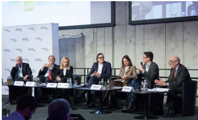
Teilnehmer der Podiumsdiskussion im Rahmen des Kongresses „Kraftstoffe der Zukunft 2018“ am 22.01.2018 in Berlin.