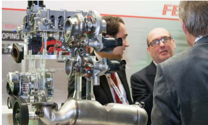
Ausstellungsobjekt im Foyer des Kongresses

Der Nachmittag konzentrierte sich auf die Grundsatzfrage zur Perspektive des Verbrennungsmotors, nicht zuletzt getrieben durch die öffentlich intensive und kritisch geführte Diskussion über den Diesel- bzw. Abgasskandal. Der „Verbrenner“ steht im Wettbewerb mit neuen Antriebstechnologien (Hybridisierung/E-Mobilität) und zudem mit innovativen Konzepten zur Verkehrsverlagerung bzw. -vermeidung. Dürfen dieser Skandal und die Problematik der nicht nur in Deutschland intensiv diskutierten Fahrverbote für Dieselfahrzeuge im Ergebnis zu einem gesetzlich verankerten Auslaufen nicht nur der Dieselmotortechnik, sondern der motorischen Antriebe insgesamt