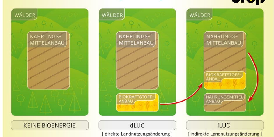
Abb. 2: Indirekte Landnutzungsänderung (iLUC)

Das Washingtoner Institut „International Food Policy Research Institute (IFPRI)“ hatte im Auftrag der EU-Kommission die Emissionswerte für Diesel- und Benzin-ersetzende Biokraftstoffe auf Basis verschiedener Rohstoffe und des Flächenbedarfs berechnet, wenn die EU ihr Biokraftstoffziel „10 Prozent erneuerbare Energien im Transportsektor ab 2020“ gemäß den Aktionsplänen der Mitgliedsstaaten (für die EU sind immerhin insgesamt 21 Mio. Tonnen Biodiesel veranschlagt) erreichen sollte. Das wissenschaftliche Institut der EU-Kommission „Joint Research Center (JRC)“ hat wiederum die Emissionswerte für Landnutzungsänderungen für acht rohstoffspezifische Biokraftstoffe sowie differenziert nach Diesel- bzw. Ottokraftstoff-ersetzende Biokraftstoffe berechnet. Diese iLUC-Faktoren sollen der Treibhausgasbilanz von Biodiesel aus Raps (s. Abb. 2) zusätzlich aufgeschlagen werden. Die Kommission hat bisher keinen formalen Vorschlag vorgelegt. Sollte sie jedoch die Werte von JRC oder IFPRI übernehmen (diskutiert werden mindestens 36 g CO 2 je MJ) steht die deutsche und europäische Biodieselproduktion auf Basis von